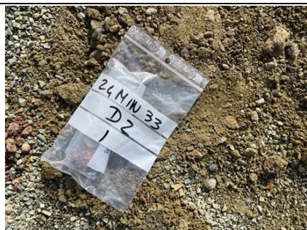
Photo n° PhA001 Localisation : Terrain de Tennis Ouvrage : Sol Description : Revêtement bitumineux rouge Localisation sur croquis : 1