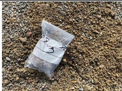
Photo n° PhA003 Localisation : Terrain de Tennis Ouvrage : Sol Description : Revêtement bitumineux rouge Localisation sur croquis : 3