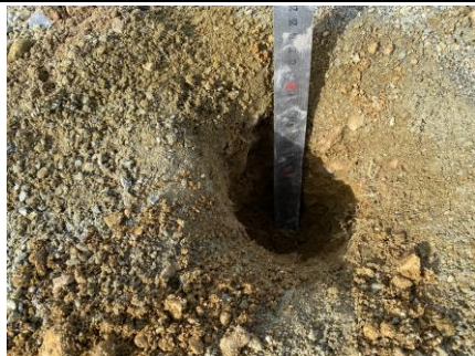
Description : Pas d'enrobé Localisation sur croquis : V1